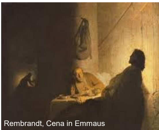
Rembrandt, Cena in Emmaus

Perché in ognuno di noi il Mistero ha posto un cuore capace di riconoscerLo, capace di sobbalzare ogni qualvolta il Suo sguardo entri in contatto con il nostro sguardo. Un cuore che il tempo, e il cinismo di questo tempo, ha forse messo a tacere, ma che la Chiesa continuamente educa e risveglia, chiamandolo a guardare oltre, ad allargare quella ragione che è un tutt'uno con il cuore e che è affermazione indomita di verità, di bellezza, di giustizia e di amore.