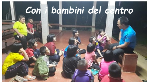
Con i bambini del centro

Come dicevo una delle mie attività è andare a trovare i fedeli nei villaggi e celebrare la santa Messa. La parrocchia dove mi trovo adesso è composta da 19 villaggi, di cui il più lontano dista 30 chilometri; nei villaggi ci sono varie cappelle dove non tutte le domeniche si riesce a celebrare la S. Messa.