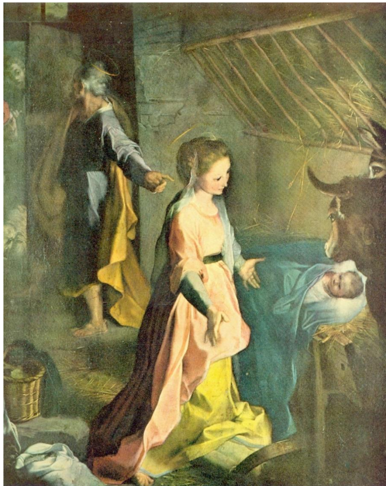
F. Barocci: S. Giuseppe ci invita a seguire Maria nell'adorazione di Gesù Bambino

La presenza della Madre di Dio nei canti Natalizi