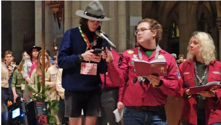
La scolta del Clan Spilimbergo I legge il messaggio alla cerimonia di Linz.

In questi giorni la Luce della Pace è arrivata anche in Italia, grazie al Movimento adulti scout cattolici italiani (Masci) che per la 27.ma volta sta organizzando la sua distribuzione, attraverso una staffetta ferroviaria partita il 16 dicembre da Trieste, con tappe in tutta la penisola che coinvolgono più di 950 gruppi scout di tutte le associazioni, dall'Agesci - gli scout e guide cattolici -, agli Scout d'Europa (Fse), Cngei e tante altre. Il tema scelto "Fare pace rende felici", è stato ricordato nella cerimonia internazionale di Linz, il 9 dicembre, quando delegazioni da tutta Europa hanno attinto alla lampada portata da Betlemme e consegnata da Michael.