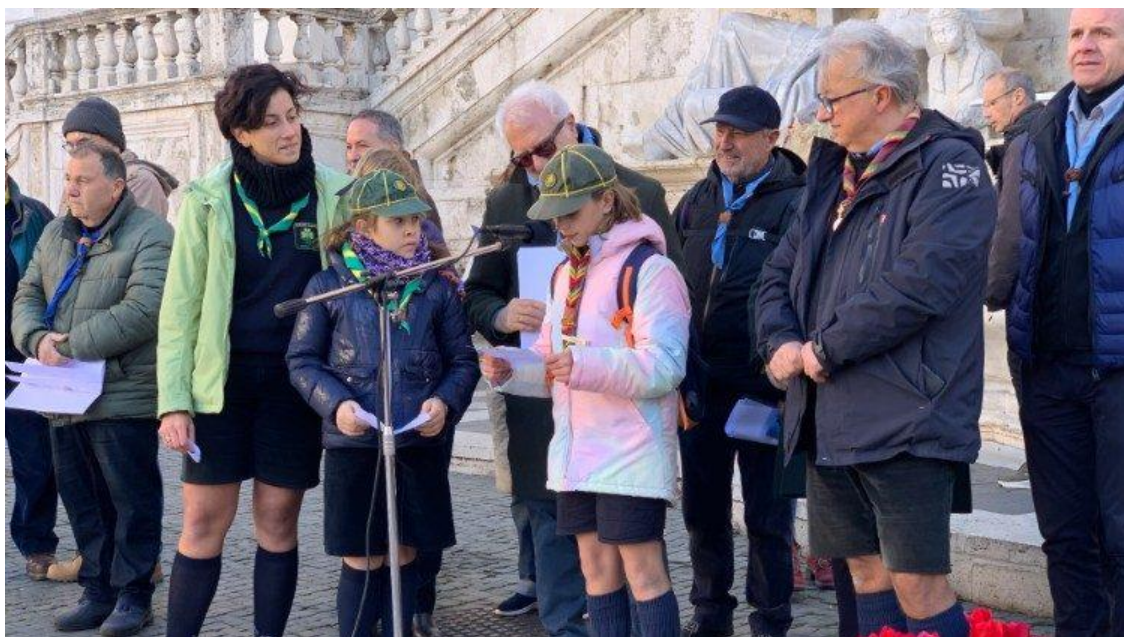
Un altro momento della cerimonia in Campidoglio. Due lupette leggono racconti di pace

arriva anche nel bar sotto casa, quando qualcuno porta la luce per far vedere questo gesto, questo significato. Anche qui al Campidoglio vedo più gente rispetto agli altri anni e dobbiamo continuare così. Perché in effetti è una luce che scalda, ma anche illumina.